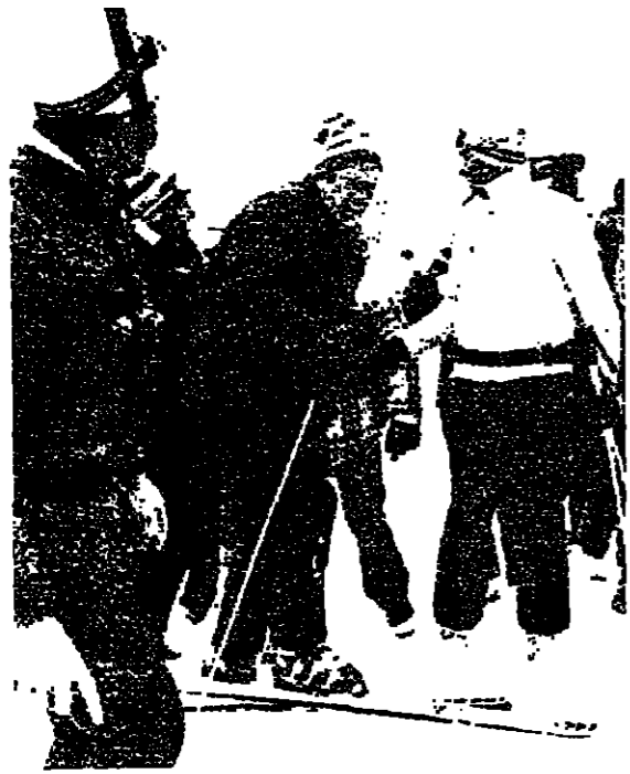
الرئيس غورد يتراجم في سان موريتز